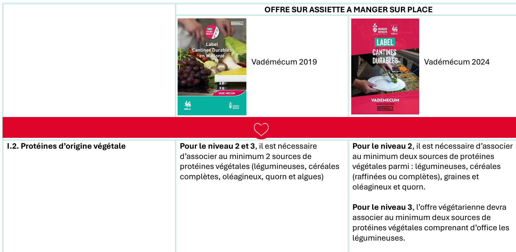
Tableau comparatif des critères modifiés Suite à la sortie de la nouvelle version du vadémécum en 2024