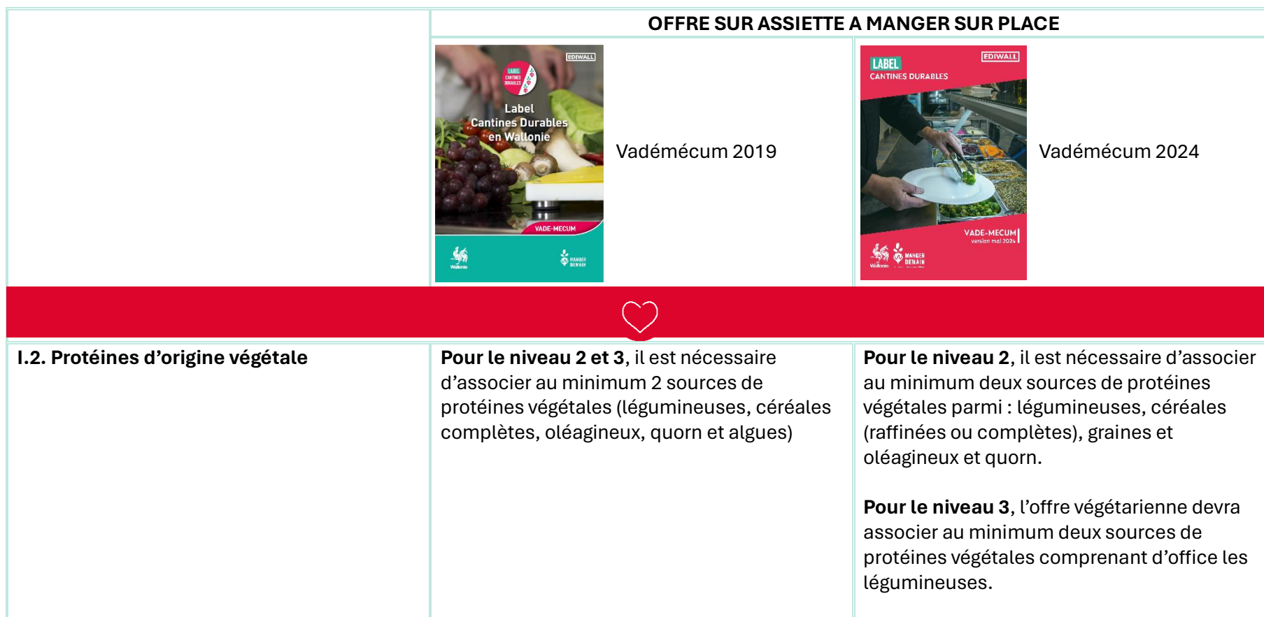
Tableau comparatif des critères modifiés Suite à la sortie de la nouvelle version du vadémécum en 2024